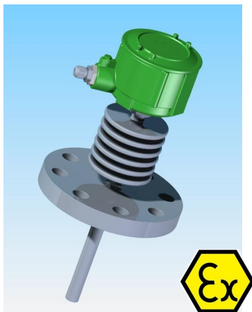
Modèle : FS-1016Ex

Le capteur surveille en continu le potentiel encrassant dans les procédés industriels en zone explosive, permettant ainsi le suivi des nettoyages en place (NEP) et par conséquent l'optimisation des traitements chimiques.